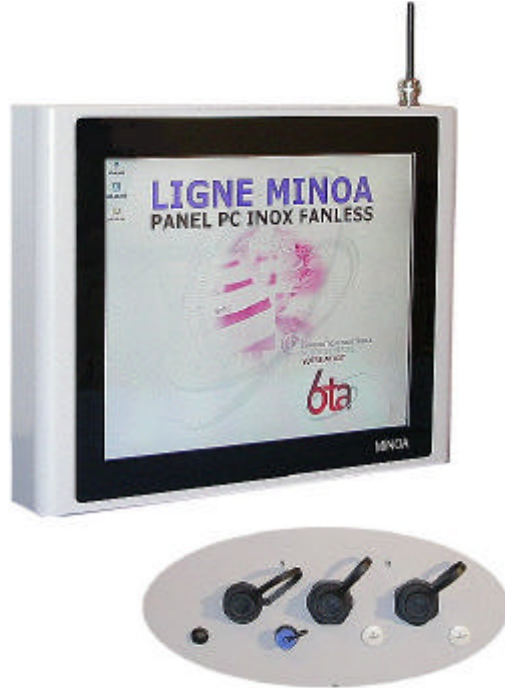
Connectiques standards étanches